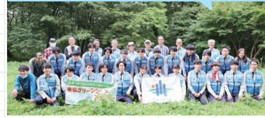
大成設備株式会社

持続可能な社会の実現に向け、年2回のボランティア活動および新入社員研修を行っています。豊かな自然を育むための里山保全活動と合わせ、環境保護や生物多様性などをテーマとした意見交換会を実施。自ら考え、実践できる将来の環境リーダー育成を目指しています。