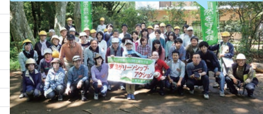
三菱ケミカルグループ株式会社

従業員に対するボランティア機会の提供により、環境保全活動への興味を促していきたいです。また、多くの従業員が参加しやすいよう、複数回活動できることも魅力です。